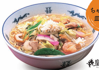
ちゃんぽん 皿うどん