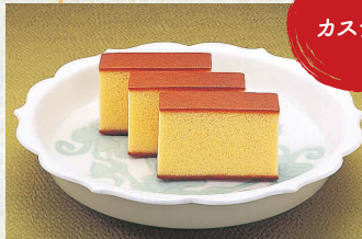
カステラ本家 福砂屋